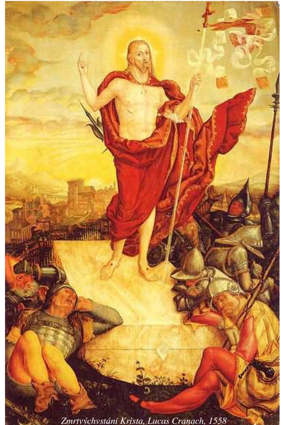
Zmrtvýchvstání Krista, Lucas Cranach, 1558

Redakční rada Farního zpravodaje přeje všem farníkům hojnost Božího požehnání ve zbývajících týdnech postní doby, o Svatém týdnu a Velikonocích... Pán Vám dopřej radost a pokoj z Krista, který vstal z mrtvých!