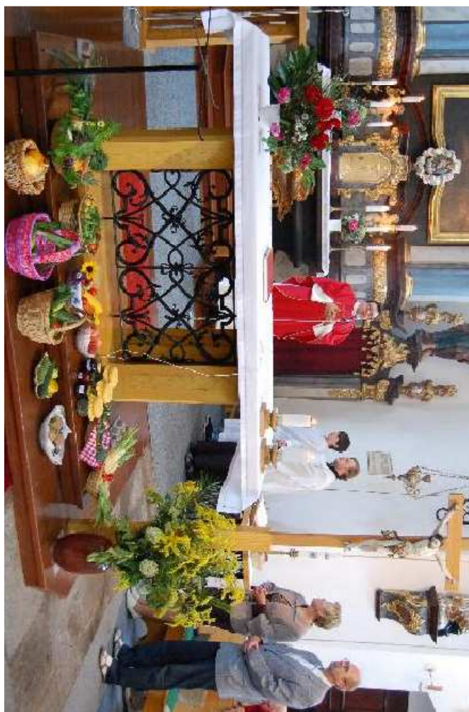
Starorožmitálská pouť s poděkováním za úrodu 15. 9. 2013