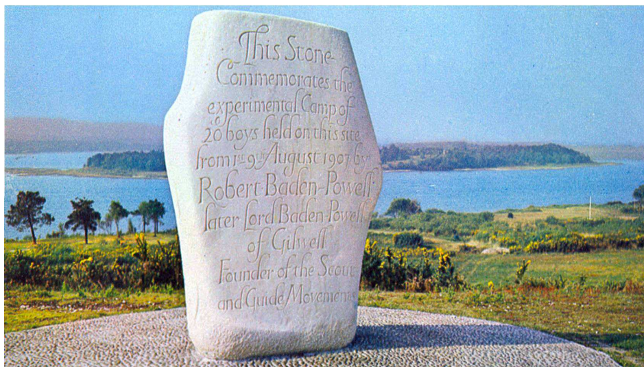
Kámen na památku prvního skautského tábora v roce 1907 na ostrově Brownsea