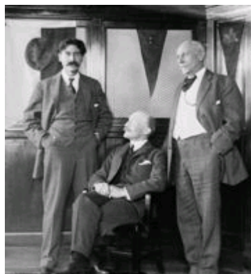
Zakladatelé a průkopníci skautingu Ernest Thompson Seton, Robert Baden-Powell a Daniel Carter Beard