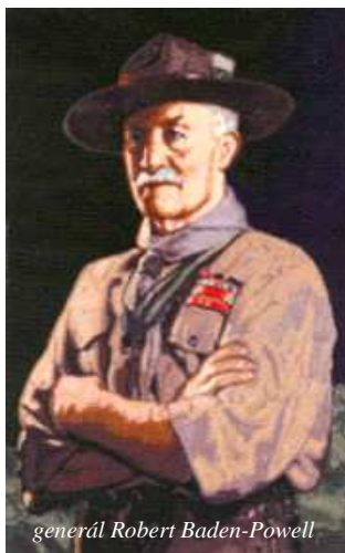
generál Robert Baden-Powell