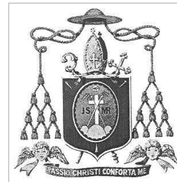
Biskupský znak sv. Jana Neumanna, 4. biskupa ve Philadelphii a prvního svatořečeného biskupa z Ameriky