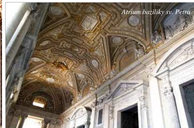
Atrium baziliky sv. Petra