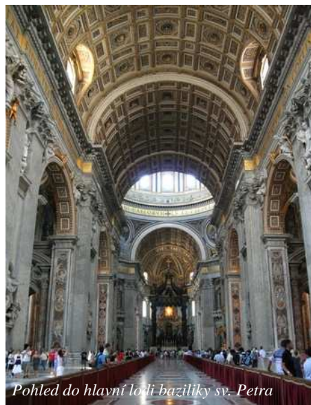
Pohled do hlavní lodi baziliky sv. Petra