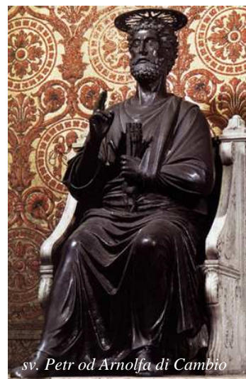
sv. Petr od Arnolfa di Cambio