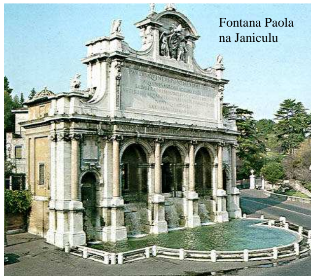
Fontana Paola na Janiculu