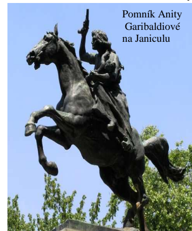
Pomník Anity Garibaldiové na Janiculu

proslulého architekta Carla Maderny. Před vítězným obloukem je hluboký a rozlehlý bazén, v němž prý římsí trhovci umývají zeleninu. Nyní tam naštěstí nikdo zeleninu nečistil, nebyly zde ani davů turistů a tak bylo možno si vychutnat na jedné straně šumící a zurčící vodu a na druhé straně pod námi široké panoráma Říma. Osobně považuji toto místo za mnohem krásnější a působivější, než návštěvníky neustále obléhanou Fontanu di Trevi, sevřenou v úzkých uličkách dole ve městě. Jak se pomalu den chýlil ke konci, začali jsme sestupovat dolů do romantického Zátíbeří (Trastevere). Cesta vede kolem velice zajímavé památky, spojené s osobou sv. Petra. Jedná se o kostel San Pietro in Montorio. Podle jedné (ovšem nesprávné) tradice totiž nebyl sv. Petr ukřižován na místě dnešního Vatikánu, ale právě zde na tak zvaném Zlatém návrší. Chrám pocházející z 9. století byl právě proto zasvěcen knížeti apoštolů a stal se dokonce tak prestižním místem, že jej pod speciální ochranu vzali španělští králové. Ti se postarali o přestavbu a výmalbu kostela těmi nejproslulejšími renesančními umělci, jako byl Michalangelo, Bramante, Raffael a další.