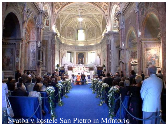
Svatba v kostele San Pietro in Montorio