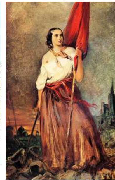
Portrét Anity Garibaldiové