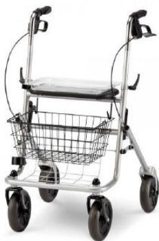
PEVNÁ A POJÍZDNÁ CHODÍTKA

Po - Ne: 8:00 – 15:00 hod. nebo po předchozí domluvě na dispečinku osobní asistence (272 933 662 | 721 142 445)