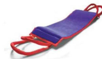
POMŮCKY K PŘESUNU