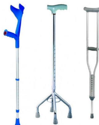
HOLE A BERLE