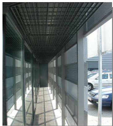
4. Brno – BVV – detail představné fasády

Na severu Moravy na nádraží v Ostravě-Svinově uvidíte kovové podhledy a zákryty z tahokovu. Zakrývají prvky technologických zařízení nové prosklené nádražní haly. (obr. 5). Z rozhledny na Hnědém vrchu v Krkonoších pohlédnete do kraje z věže tvořené nosnou dřevěnou konstrukcí v kombinaci s ocelovými prvky roštů a tahokovovými výplněmi točitého schodiště (obr. 6).