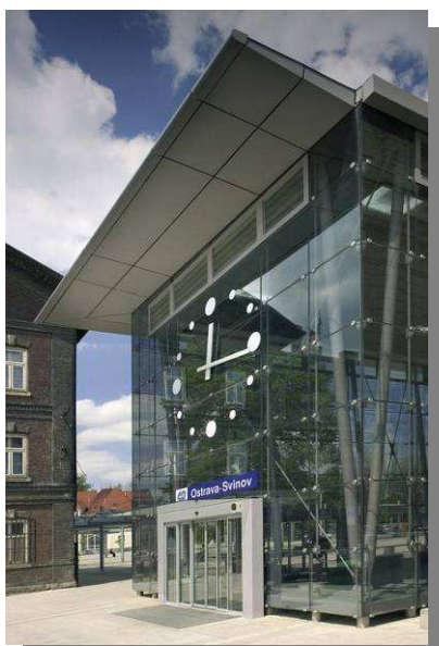
5. Ostrava-Svinov – nádražní hala (2008)

Na severu Moravy na nádraží v Ostravě-Svinově uvidíte kovové podhledy a zákryty z tahokovu. Zakrývají prvky technologických zařízení nové prosklené nádražní haly. (obr. 5). Z rozhledny na Hnědém vrchu v Krkonoších pohlédnete do kraje z věže tvořené nosnou dřevěnou konstrukcí v kombinaci s ocelovými prvky roštů a tahokovovými výplněmi točitého schodiště (obr. 6).