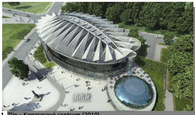
1. Zlín – Kongresové centrum (2010)

O příkladech použití ve stavebnictví je možné se zmínit o efektivní zdobné krytině střechy z tahokovu na Kongresovém centru ve Zlíně (obr. 1), obchodním a zábavním centru NISA v Liberci (obr. 2), kde představná fasáda z hliníkového tahokovu zdůrazňuje oblé linie budovy, zároveň zakrývá technologická zařízení stavby a umožňuje neomezenou variabilitu řešení obchodní reklamy a upoutávek na program zábavního centra.