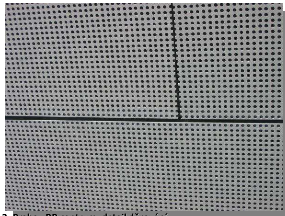
3. Praha – BB centrum, detail děrování