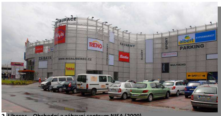
2. Liberec – Obchodní a zábavní centrum NISA (2009)

O příkladech použití ve stavebnictví je možné se zmínit o efektivní zdobné krytině střechy z tahokovu na Kongresovém centru ve Zlíně (obr. 1), obchodním a zábavním centru NISA v Liberci (obr. 2), kde představná fasáda z hliníkového tahokovu zdůrazňuje oblé linie budovy, zároveň zakrývá technologická zařízení stavby a umožňuje neomezenou variabilitu řešení obchodní reklamy a upoutávek na program zábavního centra.