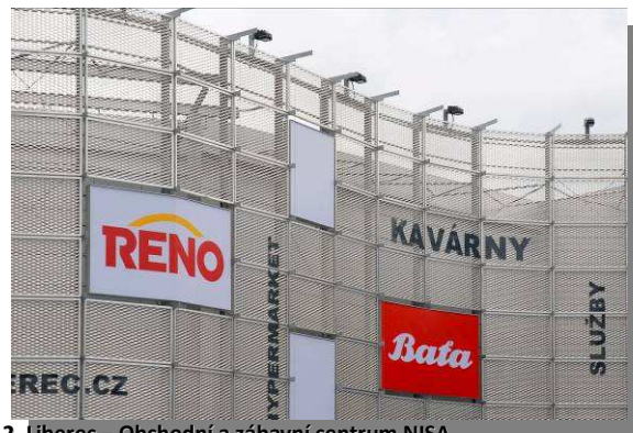
2. Liberec – Obchodní a zábavní centrum NISA

Nápadnou budovu BB Centra (obr. 3) se speciální akustickou stěnou z děrovaného plechu lze vidět z magistrály v Praze-Michli.