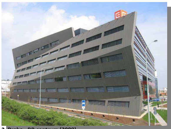
3. Praha – BB centrum (2008)

Nápadnou budovu BB Centra (obr. 3) se speciální akustickou stěnou z děrovaného plechu lze vidět z magistrály v Praze-Michli.