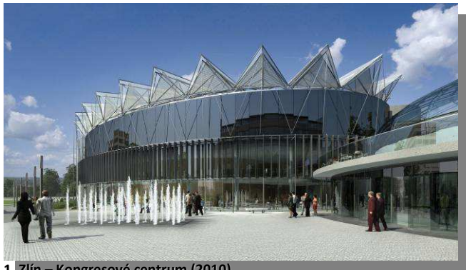
1. Zlín – Kongresové centrum (2010)

Děrované plechy, tahokov, ocelové rošty nacházejí ve stále větší míře uplatnění při architektonickém ztvárnění exteriéru a interiéru nových moderních staveb. Použití nacházejí při konstrukci fasád, venkovních žaluzií, při řešení nezvyklých výplní balkonových zábradlí, pro zakrytí únikových schodišť, dále jako materiál pro atypické podhledy a dělicí stěny. Také je používán pro prvky městského mobiliáře. Široký sortiment výrobků se využívá nejen ve stavebnictví, ale také v technologiích pro zemědělství, v potravinářském, chemickém a těžebním průmyslu.