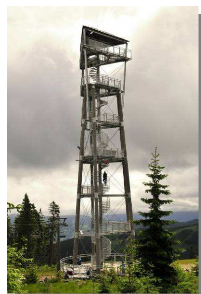
6. Krkonoše – Hnědý vrch (2009)

Za tím vším stojí největší výrobce a dodavatel perforovaných materiálů v České republice, společnost PERFO LINEA a. s. Tato společnost je značkou seriózního, kapitálově silného celku s dlouholetou zkušeností. Od roku 1993 nabízí široký sortiment výrobků pod jednou střešou. Ústředí společnosti sídlí v Chrudimi. Výrobní závod se sídlem v Prostějově zajišťuje sériovou a zakázkovou výrobu. Zboží si můžete osobně vybrat ve skladech v Chrudimi a Prostějově. Nabízíme více než 600 skladových položek děrovaných plechů, 100 položek tahokovu a 40 položek ocelových roštů k okamžitému odběru. Samozřejmostí je vlastní doprava a rozvoz po České