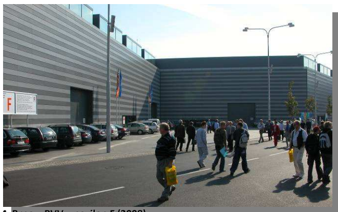
4. Brno – BVV – pavilon F (2008)

Na brněnském výstavišti stojí za povšimnutí pavilon F. Představná fasáda z děrovaného plechu plní funkci protisluneční clony před prosklenou fasádou (obr. 4).