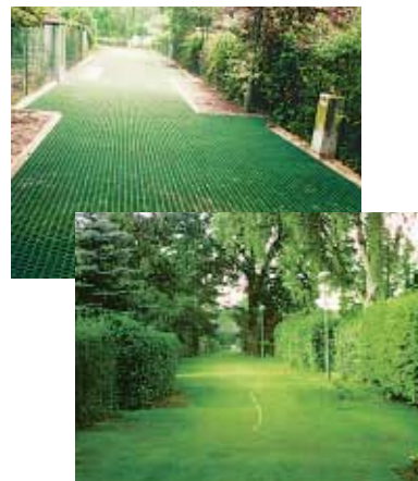
Aplikace po montáži a finální podoba