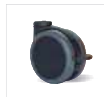
001 Nerezové provedení ocelových částí. Polyamidový disk s kluzným ložiskem a bezstopým TPU běhounem, Shore A96.