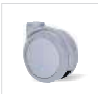
290...9006 Barevné provedení RAL 9006.