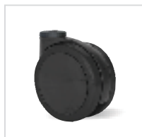
00I Nerezové provedení ocelových částí. Polyamidová kola s kluzným ložiskem.