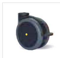
04G...y Polyamidový disk s kluzným ložiskem a bezstopým el. vodivým TPU běhounem R≤10 4 Ω, Shore A96.