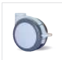
290...7035 Barevné provedení RAL 7035.