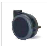
290...9004 Barevné provedení RAL 9004.