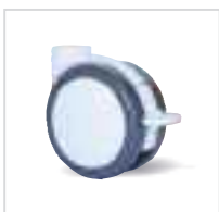
290...9003 Barevné provedení RAL 9003.