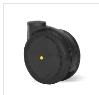
00G...a Elektricky vodivá polyamidová kola s kluzným ložiskem, R \leq 10^4 \Omega .