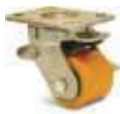
otočná kladka s úpinou brzdou