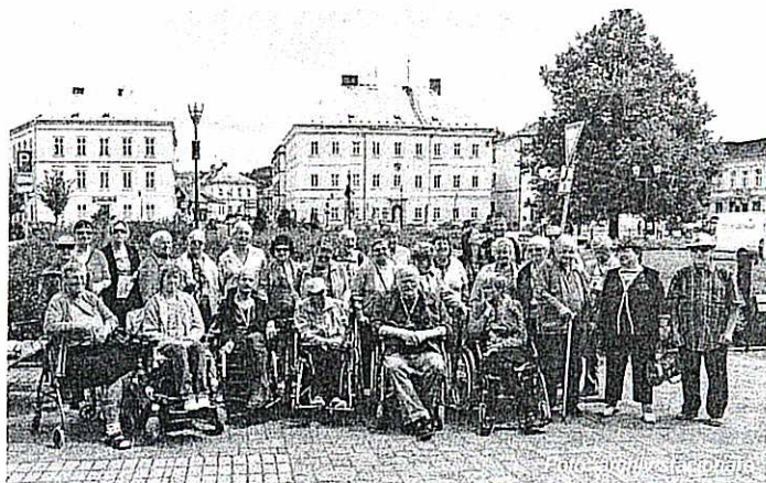
Turistický výlet k Máchovu jezeru