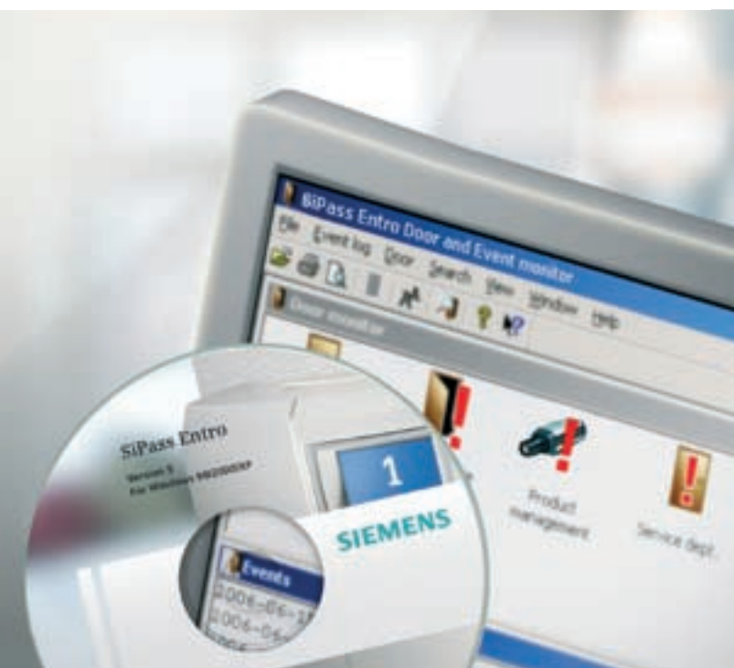
Software SiPass® Entro