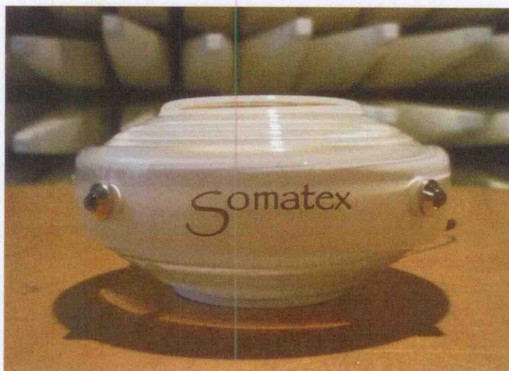
Obrázek 2.A – EUT v průběhu měření emisí

Zařízení bylo provozováno v zapnutém stavu režim svitu.