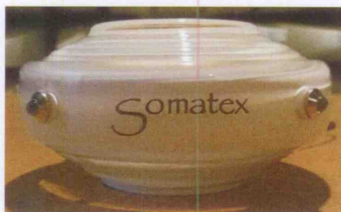
Obrázek 1.1.A – EUT

1 vzorek Somatex Atlantik, výrobní číslo 20130136, byl dodán do laboratoře ke zkouškám 1. 2. 2013 a byl zařazen do zkoušek pod číslem zakázky 414102185.