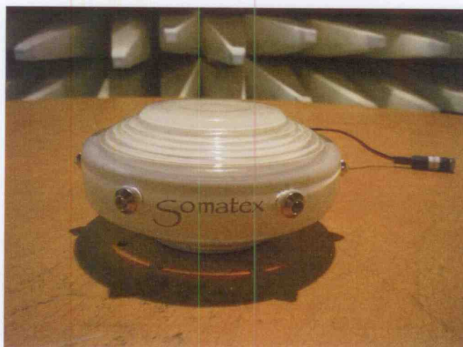
Obrázek 2.A – EUT v průběhu měření emisí

Zařízení bylo provozováno v zapnutém stavu režim svitu.