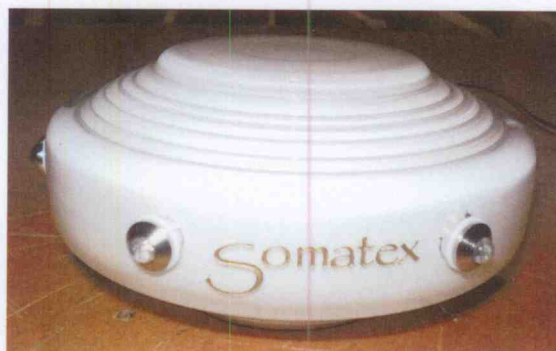
Obrázek 1.1.A – EUT

1 vzorek Somatex Quantum, výrobní číslo 201200956, byl dodán do laboratoře ke zkouškám 1. 2. 2013 a byl zařazen do zkoušek pod číslem zakázky 414102185.