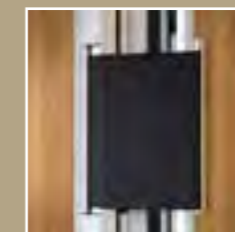
Fingerklemmschutz 180° bis Türblatthöhe für Band und Bandgegenseite