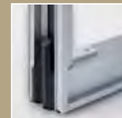
geringes Gewicht durch hochfest verschraubten Aluminiumrahmen