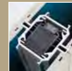
Elementverbindung TYP 100 mit kraftschlüssigem Magnetprofil