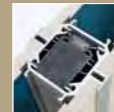
Elementverbindung TYP 100K mit sichtbarer Aluminiumkante