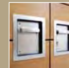
Edelstahl-Türdrücker (Turnhallenbeschlag) in flacher Bauart