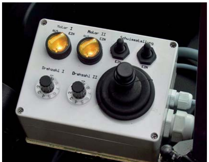
Bedienereinheiten mit Joystick-Steuerung