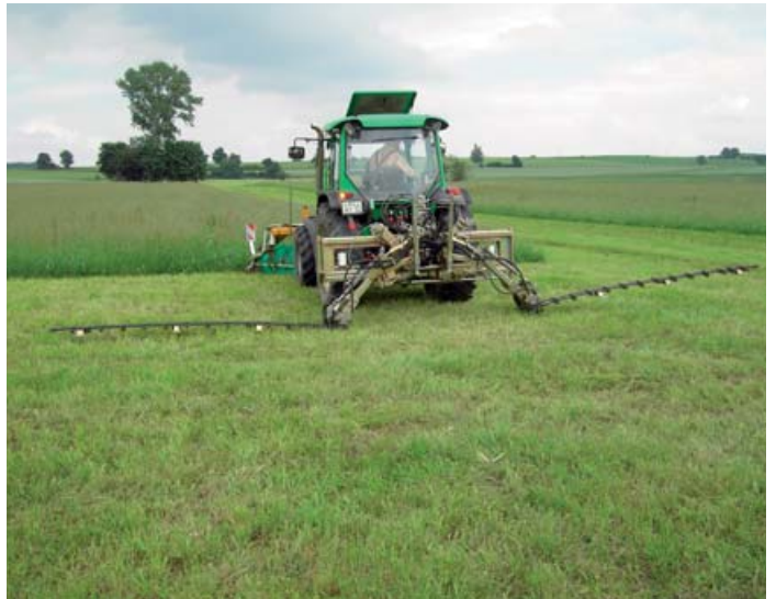
Beginn des Mäheinsatzes