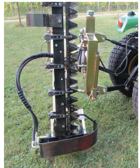
Bidux Schneidwerk mit gezahntem Untermesser