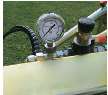
Erkennung der Leistungsaufnahme während dem Arbeitseinsatz