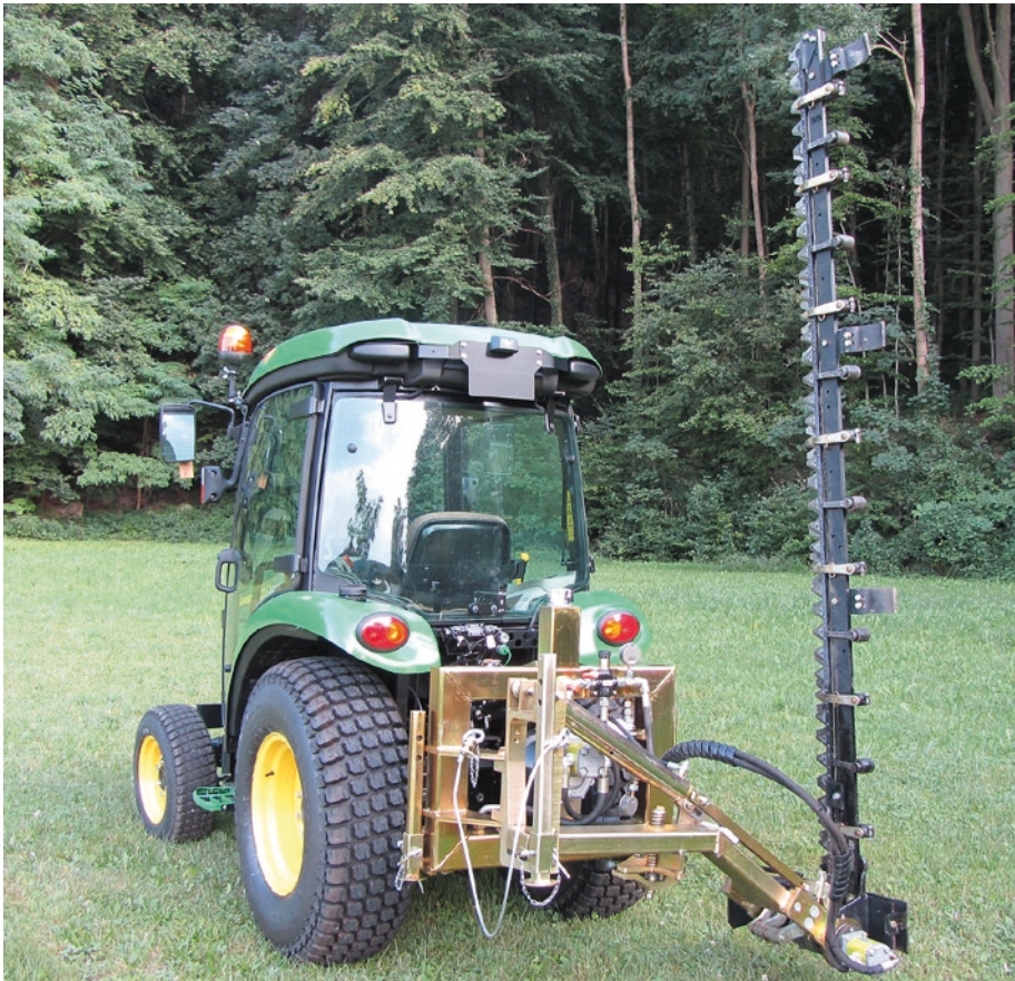
stabile Rahmenkonstruktion für Arbeitsbreiten von 1,65 m - 3,10 m