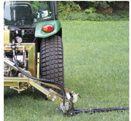
Schnittkante 0,95 bis 1,15 m