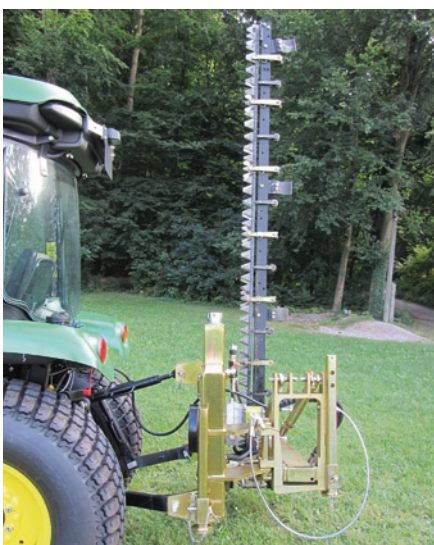
hydraulischer Antrieb über die bestehende Schlepperhydraulik