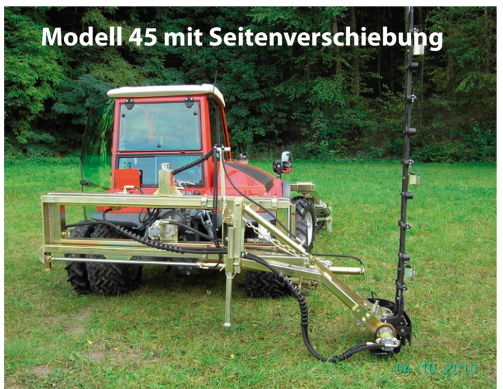
Modell 45 mit Seitenverschiebung

DMF - Doppelmesser Frontmäherwerk mit Schwadeinrichtung in Kombination mit Heckmäherwerk