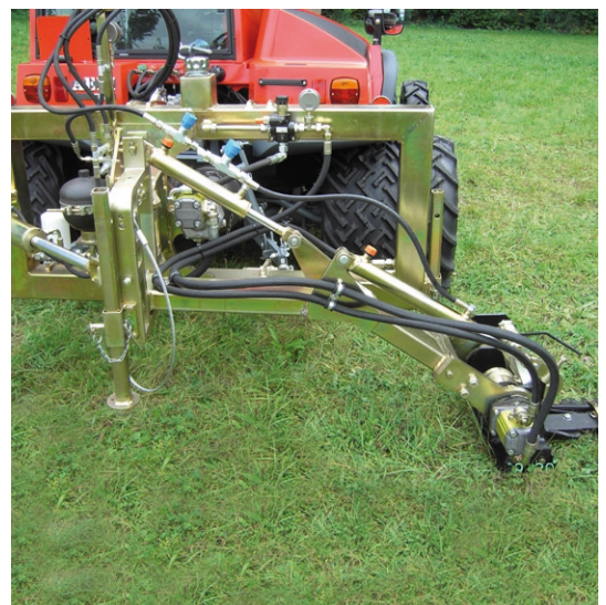
Aufzugsverstärkung mit 2 Zylinder