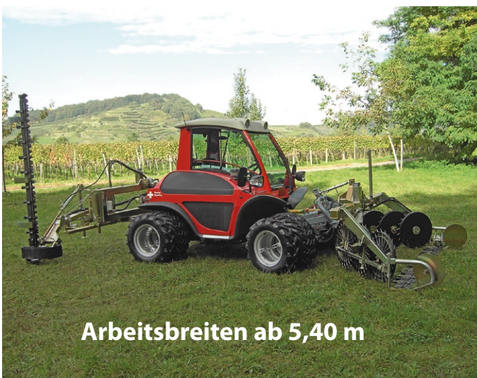
Arbeitsbreiten ab 5,40 m

DMF - Doppelmesser Frontmäherwerk mit Schwadeinrichtung in Kombination mit Heckmäherwerk