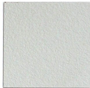
3 grau 7035 grey 7035 ähnlich/similar RAL 7035; NCS S 1500 N