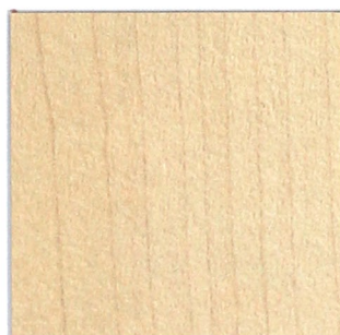
13 ahorn natur 850 maple nature 850