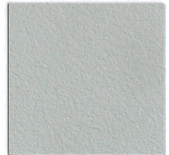
4 silbergrau 26 silver grey 26 ähnlich/similar NCS S 2500 N