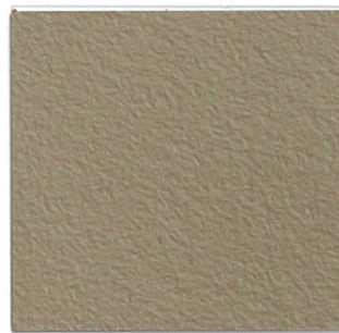
7 macchiato 60 ähnlich/similar NCS S 4010-Y30R