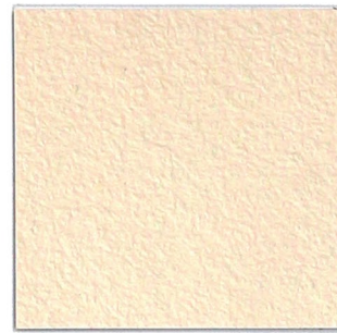
6 jasmin 49 jasmine 49 ähnlich/similar NCS S 0505-Y50R