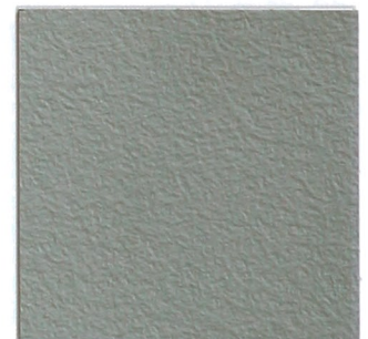
8 betongrau 69 cement grey 69 ähnlich/similar RAL 7004; NCS S 4502 B