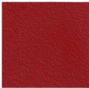
9 weinrot 52 red wine 52 ähnlich/similar RAL 3011; NCS S 3060 R