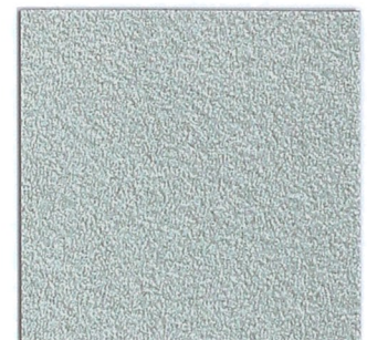
12 weißaluminium 9006 aluminium 9006 ähnlich/similar RAL 9006