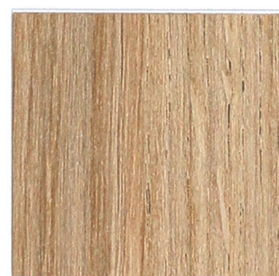
15 eiche klassik 842 classic oak 842