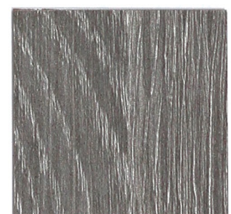
16 eiche silber 841 silver oak 841