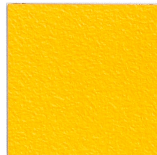
10 sonnengelb 73 sunshine yellow 73 ähnlich/similar RAL 1003; NCS S 5060-Y10R