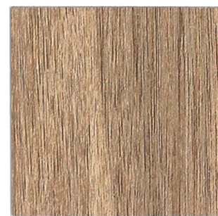
14 nussbaum hell 856 bright walnut 856