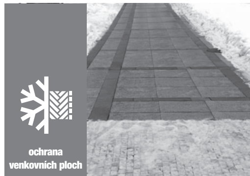
ochrana venkovních ploch