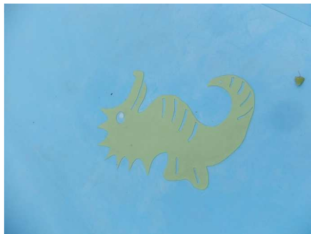
Obr. 6 – Detail designového prvku