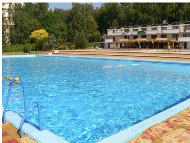
Obr. 1 – Plavecký bazén

Z obrázků 7-9 je patrné, že se na povrchu fólií projevil zub času a nedostatečná údržba. Ale to nemění fakt, že fólie jsou stále funkční a odolné veškerým projevům klimatu i lidského působení. Fólie se dobře udržují a lehce opravují v případě poškození. To se nám ostatně potvrdilo i při nedávné havárii bazénu, kdy došlo k napuštění místa pod fólií vlivem špatně proudící trysky (obr. 10). Fólie musela být rozříznuta (obr. 11), aby voda mohla odtéci a místo se opravilo záplatou (obr. 12).