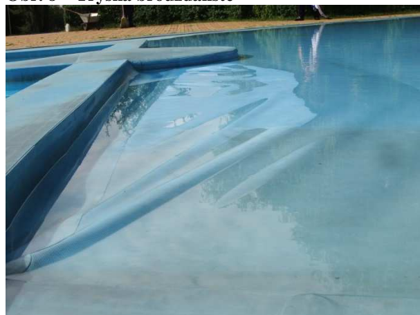
Obr. 10 – Havárie, vyboulení fólie