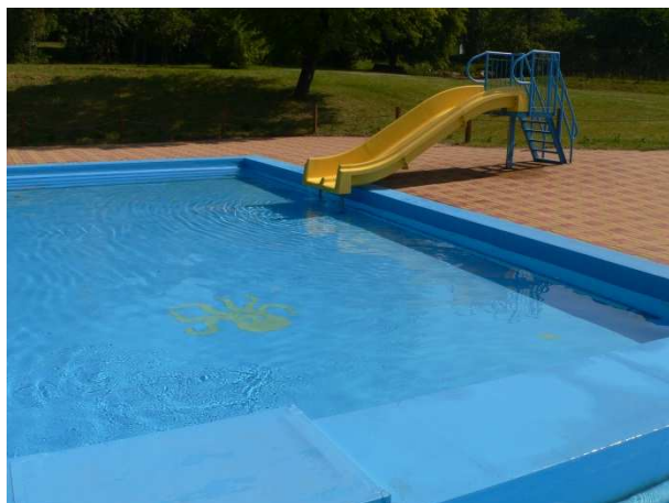
Obr. 5 – Dětský bazén se skluzavkou