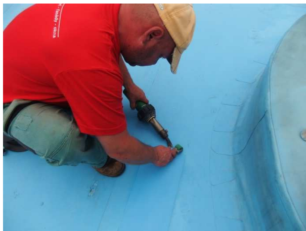
Obr. 12 – Havárie, záplata