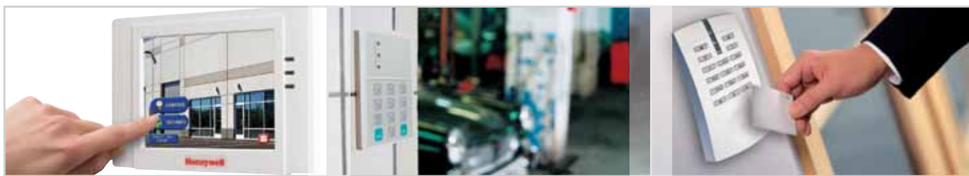
Nová grafická dotyková klávesnice